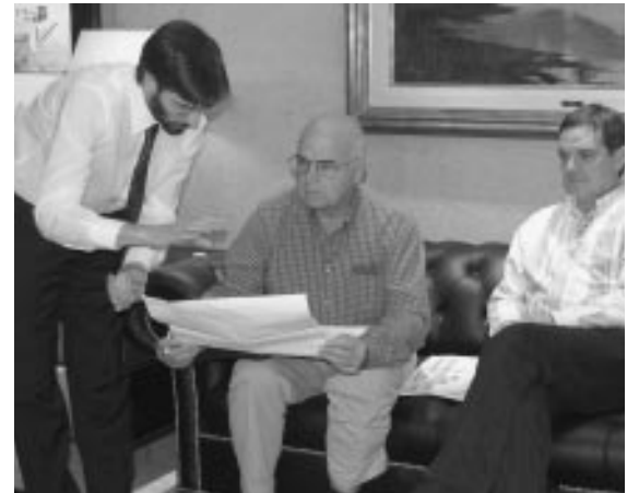
Reunión del equipo rector de EuskoSare en Argentina.