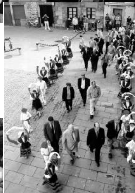
Aramaiokocelebración, durante todo el mes de septiembre, el centenario de los Juegos Florales.