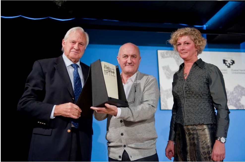
Premio Orfeón Donostiarra / UPV 2012