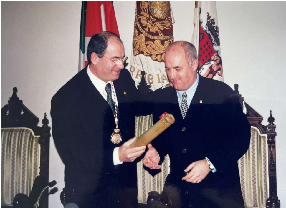
Hondarribiako Urrezko domina 1999