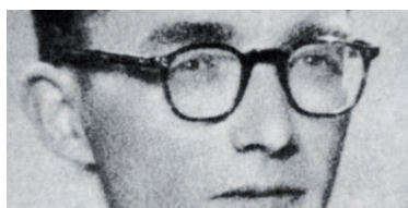
Julián de Ajuriaguerra