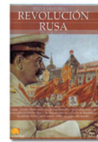
Breve Historia de la Revolución Rusa