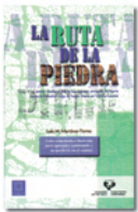
La Ruta de la Piedra

AUTOR: LUIS M. MARTÍNEZ-TORRES LEIOA: UPV/EHU, 2009 79 P. : 18 CM ISBN: 978-84-9860-060-5