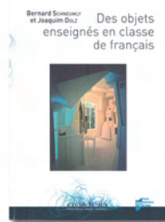
Des objets enseignés en classe de français