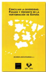
Conciliar la diversidad. Pasado y presente de la vertebración de España

Esta "Guía comentada e ilustrada para aprender caminando y no perderse en el camino" nos anima a recorrer el camino medieval desde las canteras antiguas de Ajarte, de donde se sacaron las piedras para la Catedral Vieja de Vitoria, hasta dicho templo. En cada parada se describe algún concepto o idea referente a las piedras, su transporte, el camino, etc., y después se realizan algunos comentarios relacionados, o no, con la descripción previa. Una guía para llevar en el bolsillo durante una excursión didáctica y entretenida que puede realizarse cómodamente en menos cinco horas de plácido paseo. Una buena idea estupendamente ejecutada.