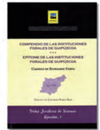
Compendio de las instituciones forales de Guipúzcoa