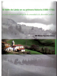
El Valle de Léniz en su primera historia (1260-1750)