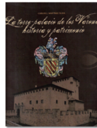
La torre-palacio de los Varona: historia y patrimonio

Esta obra es el resultado a 30 años de vinculación de la autora con el Valle de Léniz. Se divide en once capítulos. Comienza estudiando el contexto geográfico y las distintas segregaciones sufridas desde la constitución de Arrasate en 1260 hasta el nacimiento del "Valle y tierra de Léniz". Se analizan los conflictos con poblaciones vecinas y su incorporación al Señorío de Oñate. La integración en la Hermandad de Gipuzkoa y, como consecuencia, la intervención armada del Duque de Nájera, precede a la descripción del proceso de segregación. El último capítulo se ocupa de los intentos de capitalizar el Valle.