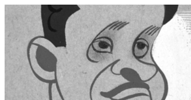
Manuel de Irujo