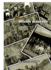
Veinte oficios mineros