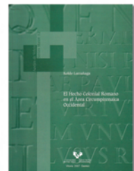
El hecho colonial romano en el área circumpirenaica occidental