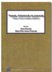
Testuak, diskurtsoak eta generoak. Euskal testuen azterketa korrontea